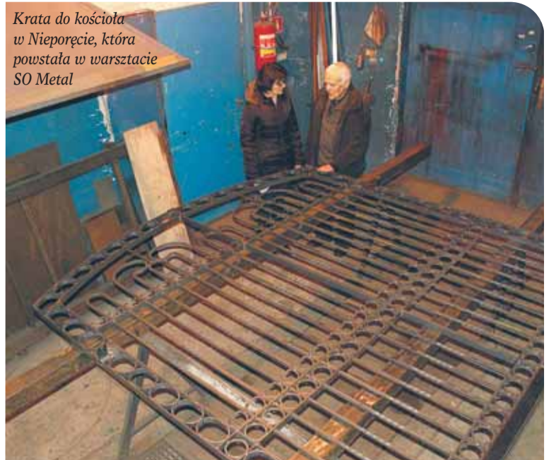
Krata do kościoła w Nieporęcie, która powstała w warsztacie SO Metal