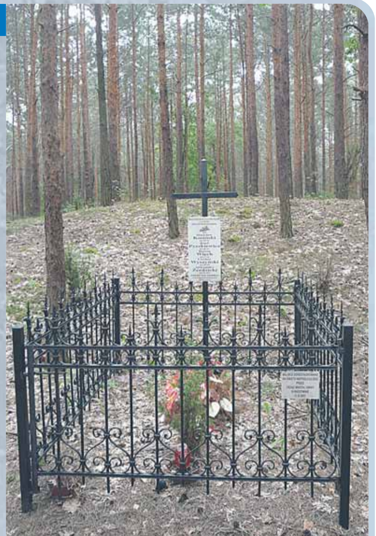
Miejsce rozstrzelania przez Niemców pięciu Polaków w dniu 7 września 1939 roku w lesie pod Arciechowem